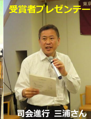
受賞者プレゼンテーション