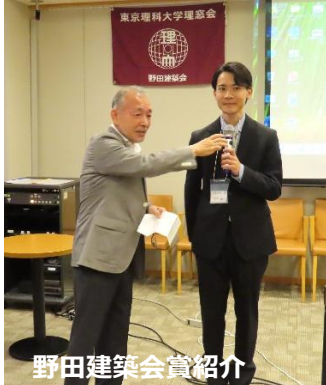
野田建築会賞紹介