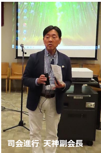
司会進行 天神副会長

2026年5月23日14時から築理会総会が神楽坂校舎1号館17階で開催されました。引続き同会場で講演会が野田建築会との合同で開催され、その後PORTA神楽坂6階理想会倶楽部に移動して、17時から野田建築会との合同懇親会が開催されました。築理会・野田建築会、両会長の開宴挨拶や元野田建築会会長による乾杯の後、「リボンの紹介」、「築理会賞、野田建築会賞の報告」、「受賞者からのプレゼンテーション」や「参加者の近況報告」等があり、最後に「校歌斉唱」、閉会挨拶や全体写真撮影の後、19:45頃散会しました。今回は、築理会の「名簿データベース登録キャンペーン」として、未登録の方がその場で登録できるコーナーも設営されていました。上の写真は最後まで残っていた方での写真撮影です。以下の写真の氏名に野田建築会の方には(野)と追記してあります。