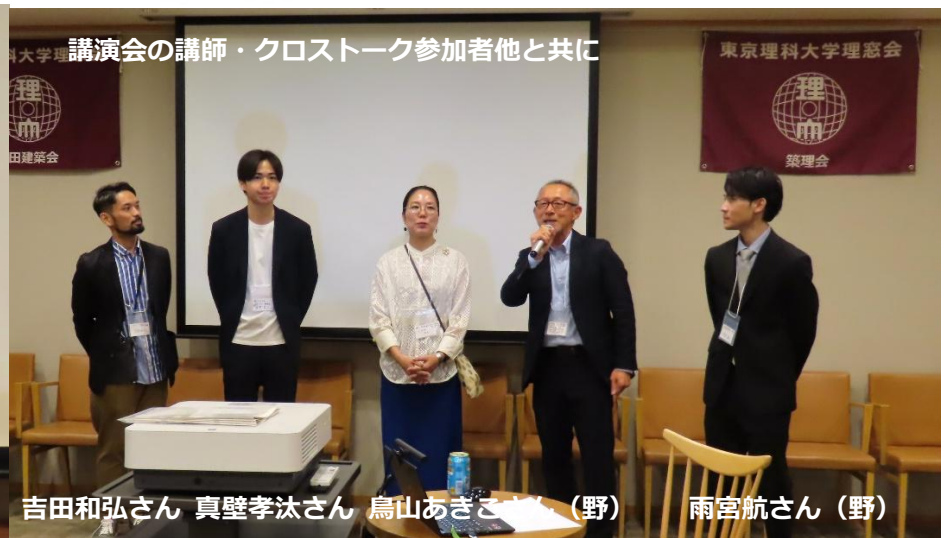
講演会の講師・クロストーク参加者他と共に